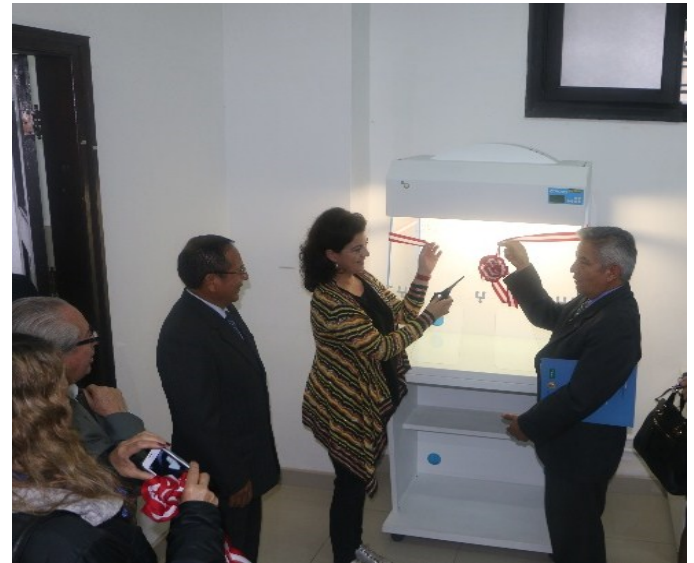
Inauguración del Laboratorio de Investigación Científica de la Dirección de Conservación

El Archivo General de la Nación, como el principal centro de preservación del Patrimonio Documental de la Nación, siempre anheló tener un Laboratorio donde se pueda investigar sobre la presencia de los distintos tipos de hongos y bacterias que atentan contra la integridad de los documentos, y también la salud de los trabajadores.