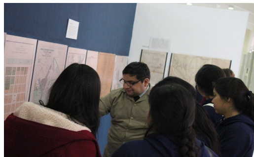
Visita guiada a los estudiantes del Colegio Salcantay

La exposición más visitada es la exhibida en la Sala de Exposiciones “Mons. Antonio San Cristóbal Sebastiani” de la Dirección de Archivo Colonial. Entre los visitantes destacan los particulares a título personal y las oficiales, siendo los más recientes de las siguientes instituciones: Municipalidad Provincial del Callao, Agencia de viajes Cóndor Travel, Escuela de Capacitación y Perfeccionamiento de la FAP, Universidad César Vallejo, Historia del Arte de la UNMSM, Colegio Salcantay y expositores internacionales del “I Congreso Internacional de Archivos Históricos”.