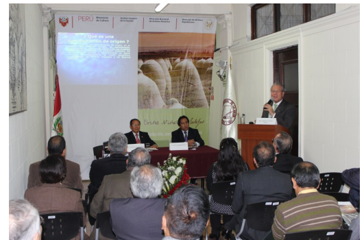
Conferencia "El Pisco en el alma del pueblo peruano. Su antigua historia y proyección al futuro".