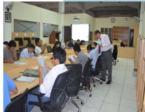
Alumnos del curso-taller leyendo los manuscritos del S.XVII al XIX.

Este curso-taller forma parte de las actividades de esta Dirección Nacional que buscan crear conciencia acerca de la importancia de los documentos en nuestros días.