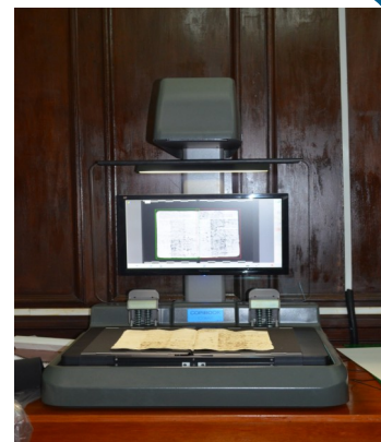
Escáner CopiBook Cobalt de última generación.