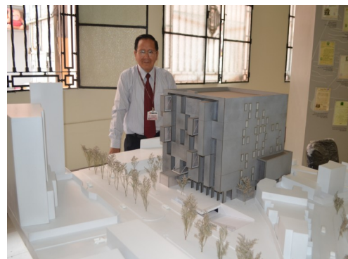
Maqueta del diseño ganador.

En estos últimos años, el anhelado sueño de construir un local con los últimos avances de la arquitectura y la ingeniería civil, al parecer, se estaría volviendo realidad. El año pasado se convocó a concurso el diseño del nuevo local, siendo elegido el ganador a fines de ese año. Las fotos dan a conocer el diseño ganador y su respectiva maqueta, reflejo de lo que se comenzaría a construir en un futuro muy próximo.