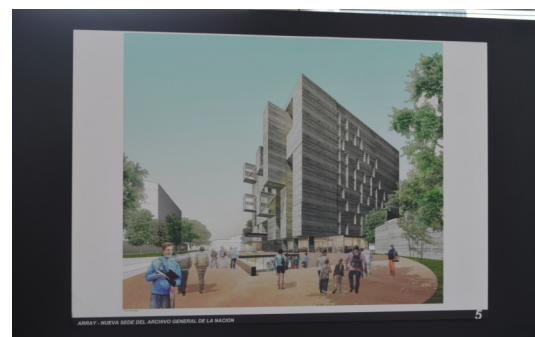
Futuro local del AGN.

El Archivo General de la Nación, como principal institución archivística peruana, desde de su crea-