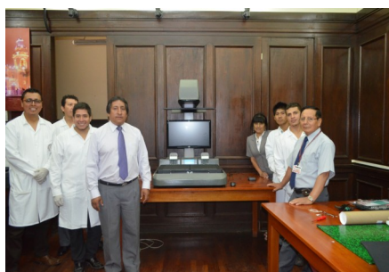
Equipo de digitalización con el Jefe Institucional y escáner instalado.

Finalizando el año 2013 y a principios del 2014, el AGN adquirió para la Dirección de Conservación (DC) tres (03) escáneres A2 CopiBook Onyx, cuyas características (excelente calidad de imagen, productividad y confiabilidad) han sido ideales para digitalizar los manuscritos encuadernados del siglo XVI. Con esta importante adquisición se han ido digitalizando los protocolos notariales así como el fondo de Superior Gobierno.