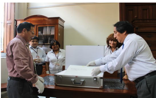
Jefe Institucional y personal de la DNAH.