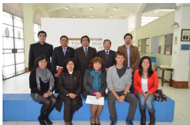
Capacitación recibida sobre el uso del software ArchiDOC.

Durante muchas décadas, en el Archivo General de la Nación, ha primado la descripción de fondos y colecciones documentales a nivel de las unidades de conservación; elaborando para ello los inventarios registro con plantillas heterogéneas, cuando debió describirse a nivel de unidad documental y de manera homogénea o normalizada. Es por ello que, gracias a una ardua gestión, se logró adquirir e instalar durante el cuarto trimestre del año 2014, el software ArchiDoc.