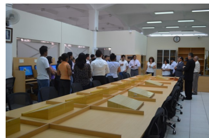
Inauguración de la renovada S.I.

El servicio archivístico es una de las funciones esenciales de todo Archivo; es por ello que una infraestructura adecuada es vital para desempeñar esta labor.